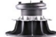
zelfnivellerende tegel drager