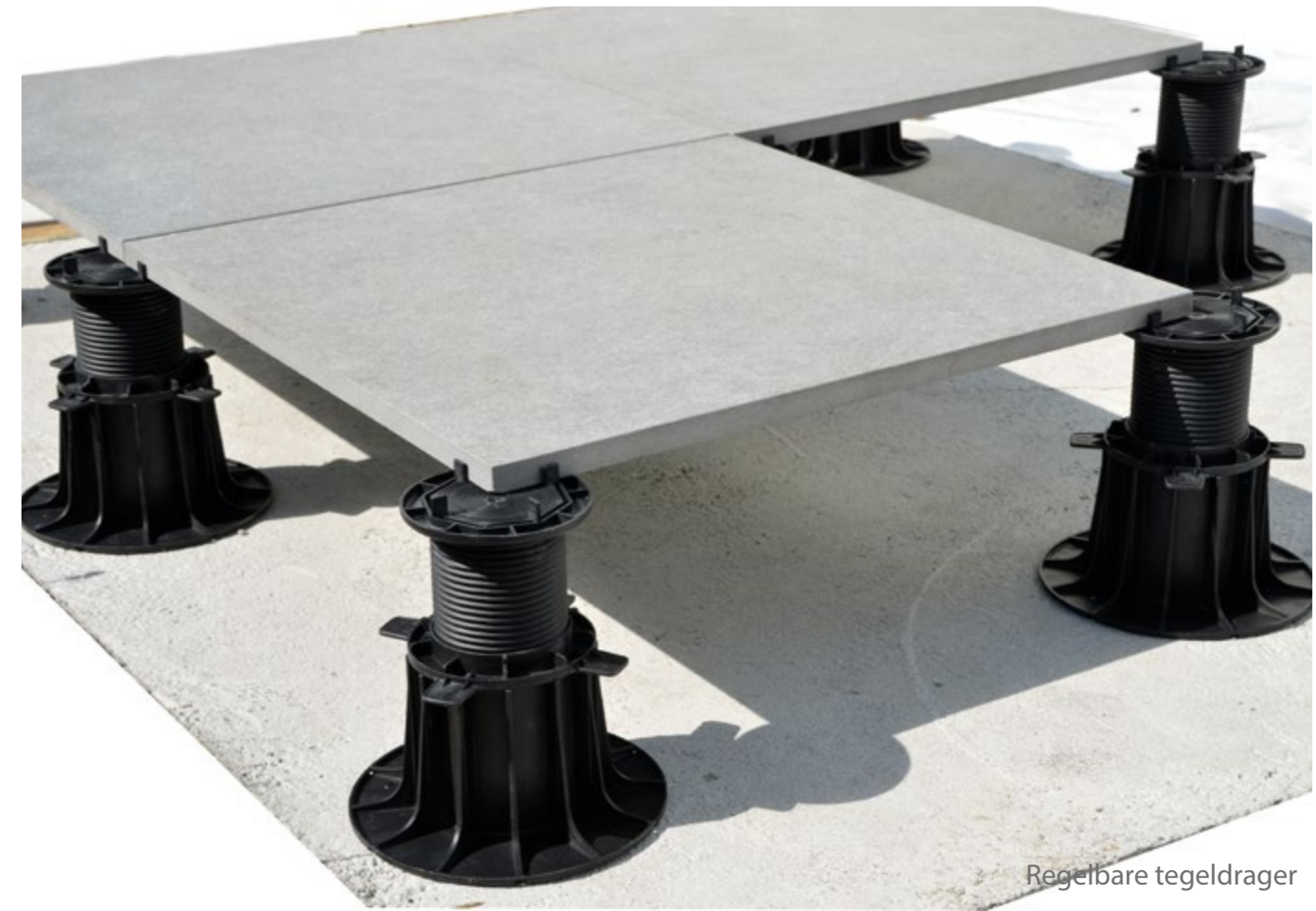
Regelbare tegel drager