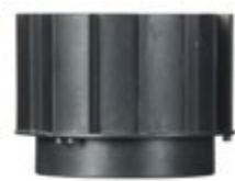
verlengstuk 60 mm