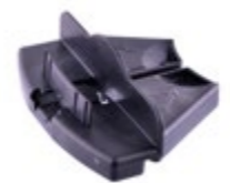
verticale steun voor plint