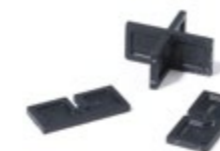
afstandhouders 3 mm