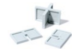
afstandhouders 5 mm