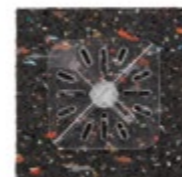
tegelkruis op rubberen drager